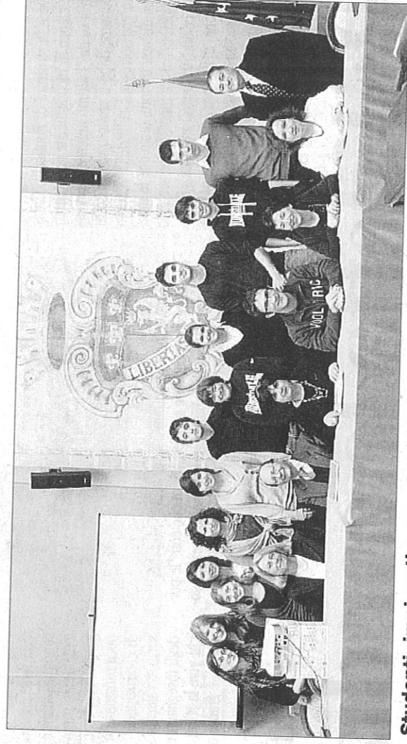
Studenti, impiegati e amministratori uniti dal Progetto Mercurio

tutta Italia pari a euro 26.925 euro destinati al campo di San Biagio-Tempera. Ora, a Imola si promuove una raccolta di generi necessari al campo. La raccolta sarà attiva per due settimane presso la federazione Prc di Imola, via dei Mille 24, dalle 8 alle 11 di tutti i giorni feriali tranne il giovedì. Info: 0542-28284.