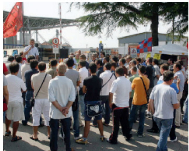
PROTESTA Il presidio alla Cnh è finito ma la situazione dello stabilimento di via Selice resta ancora in alto mare

A PREOCCUPARE Confartigianato però non è la differenza tra aperture e chiusure di aziende (di poco positiva a fine novembre), ma il tasso di disoccupazione in crescita nei prossimi anni (+4-5% all'anno). Per Confartigianato questo si rifletterà sulla capacità di spesa delle famiglie, che rischia di essere ulteriormente indebolita da una possibile ripresa dell'inflazione. Infine, secondo l'associazione di Renzi, occorrerà vigilare di più sulle attività irregolari che potrebbero subire un'impennata.