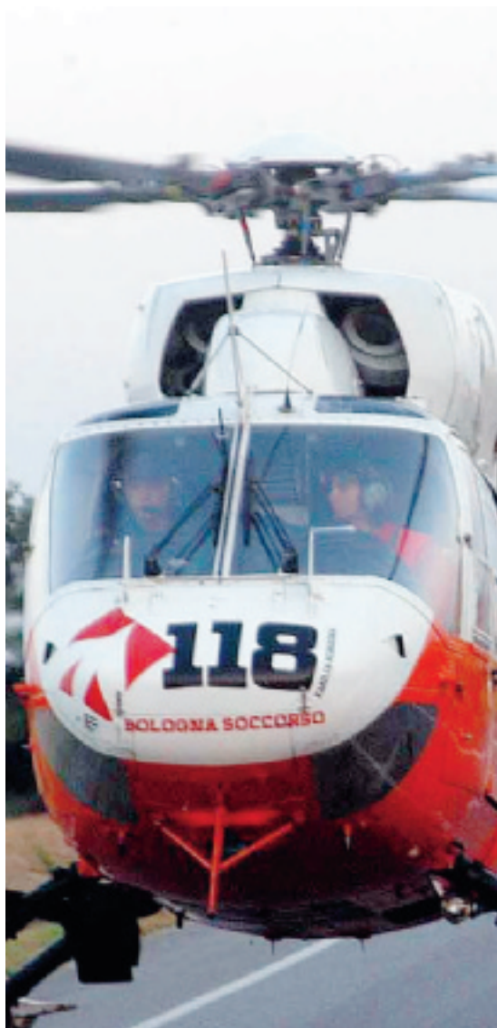
CODICE ROSSO E' stato un elicottero del 118 ieri mattina a soccorrere l'anziana ciclista travolta da un'auto in via Scania